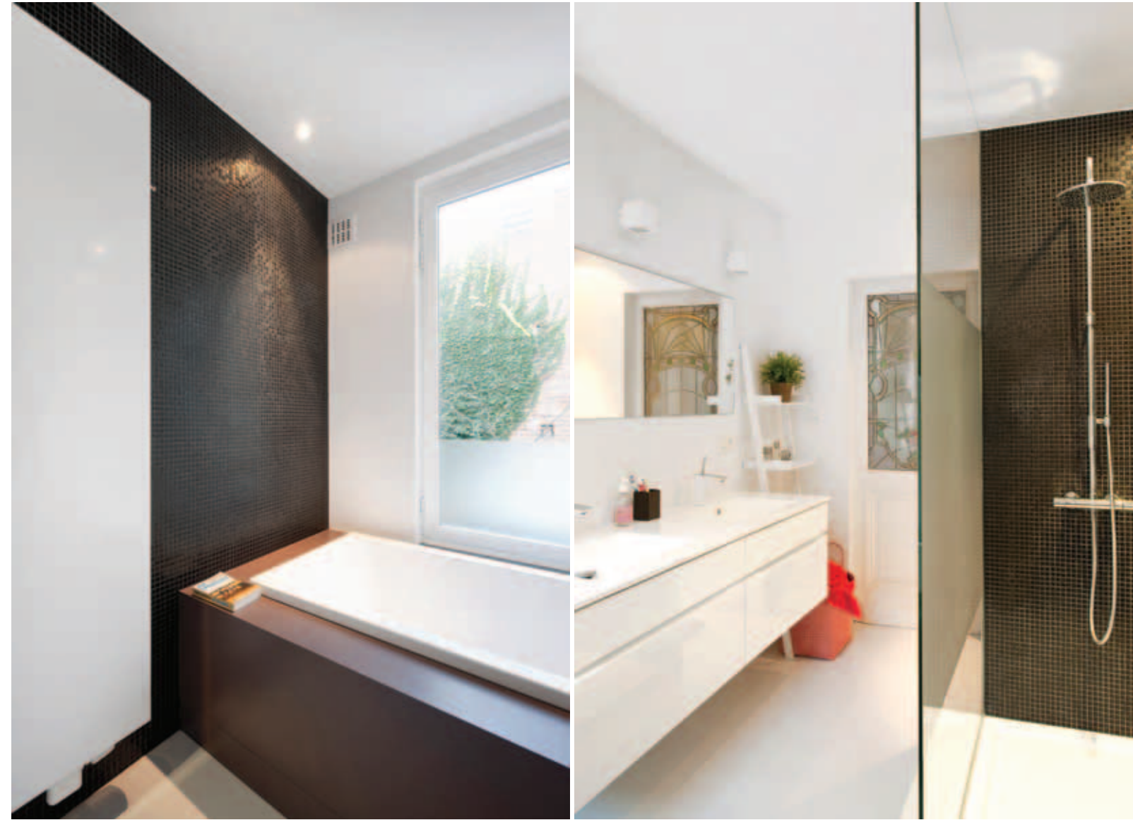
De smalle badkamer werd optimaal benut met een dubbele wastafel (kvik), een ligbad (Duravit) en een grote inloopdouche. De witte opbouwarmaturen zijn van PSM Lighting.

grote boekenkast die mooi zou blenden met de woonruimte.” Het bijzondere, zwevende ontwerp doet eveneens dienst als familie bureau en is zo zeer functioneel. Catharina tekende een kast met gesloten en open elementen, waarbij de gesloten elementen onderaan dienst doen als speelgoedkast. De gekleurde vlakken in mosterdgeel en warm grijs zorgen voor een creatief accent.